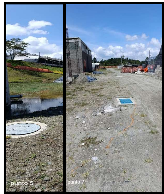
Fotos n 1. Registro fotográfico, en condiciones sin lluvias de la PTAR Tranvía.

EPM adjuntó el registro fotográfico mostrado en la visita del 10 de noviembre de 2025 por parte de la Contraloría Distrital de Medellín tomado el día anterior, en condiciones sin lluvias, donde se observa el terreno seco como resultado de las labores de mantenimiento implementadas.